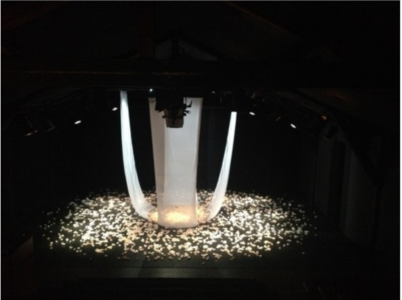
Dispositif général. Scénographie Claire ELOY